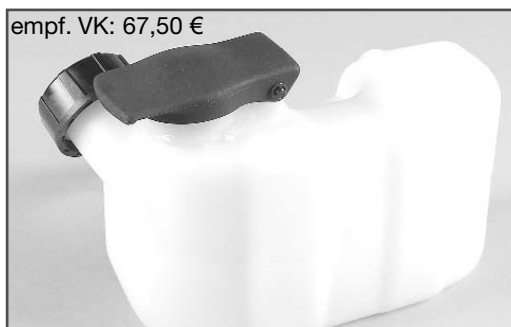
Best.-Nr./ Item N°. 10348 Zenoah tank kpl. mit Schnellverschluss, 1 St. Zenoah tank compl. with snap closing, 1 pce.

New constructed front damper reversing for FG F1 Competition chassis. Ball-bearing damper reversing with M5 fastening. Enlarged shock absorber distance. The set includes all parts necessary for the conversion.